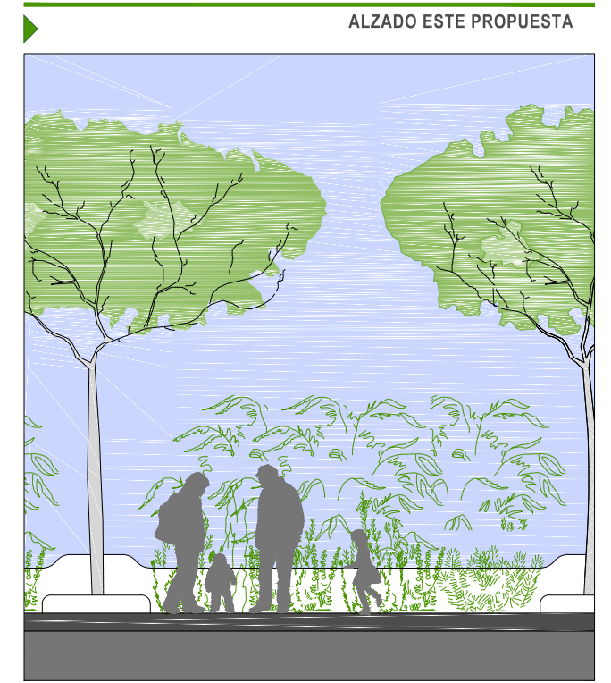
ALZADO ESTE PROPUESTA