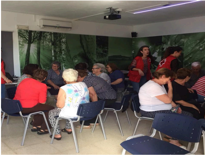
( http://www.sansilvestredeguzman.es/export/sites/sansilvestre/es/.galleries/imagenes-noticias/2016/18700290_10154669217161009_28327/ )