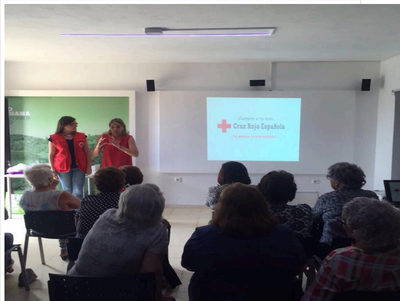
( http://www.sansilvestredeguzman.es/export/sites/sansilvestre/es/.galleries/imagenes-noticias/2016/18767462_10154669217181009_79206: )