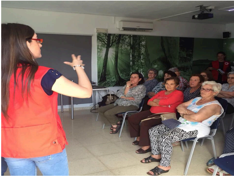
( http://www.sansilvestredeguzman.es/export/sites/sansilvestre/es/.galleries/imagenes-noticias/2016/18767761_10154669217196009_47134: )