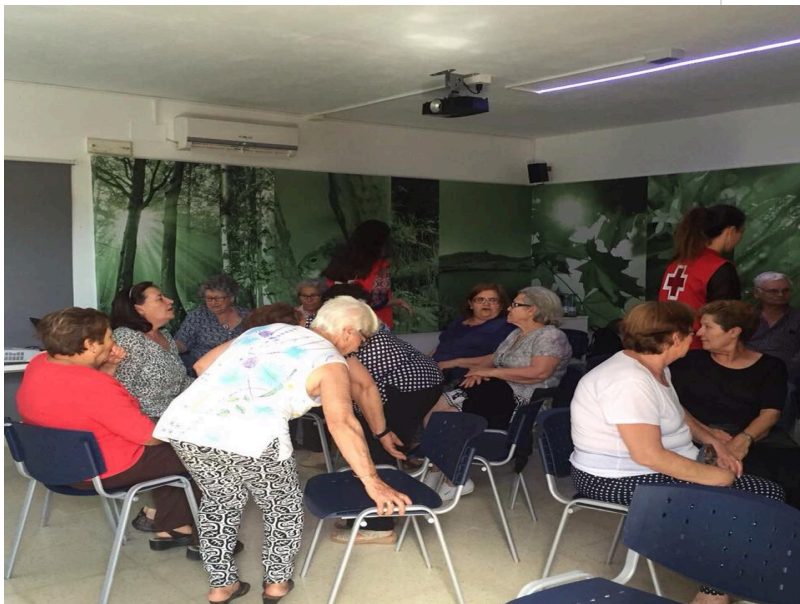
( http://www.sansilvestredeguzman.es/export/sites/sansilvestre/es/.galleries/imagenes-noticias/2016/18767805_10154669217186009_52653/ )